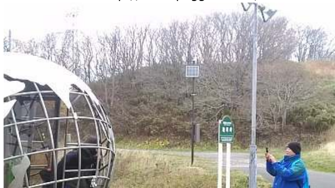
ポジモの設置例(室蘭市地球岬)